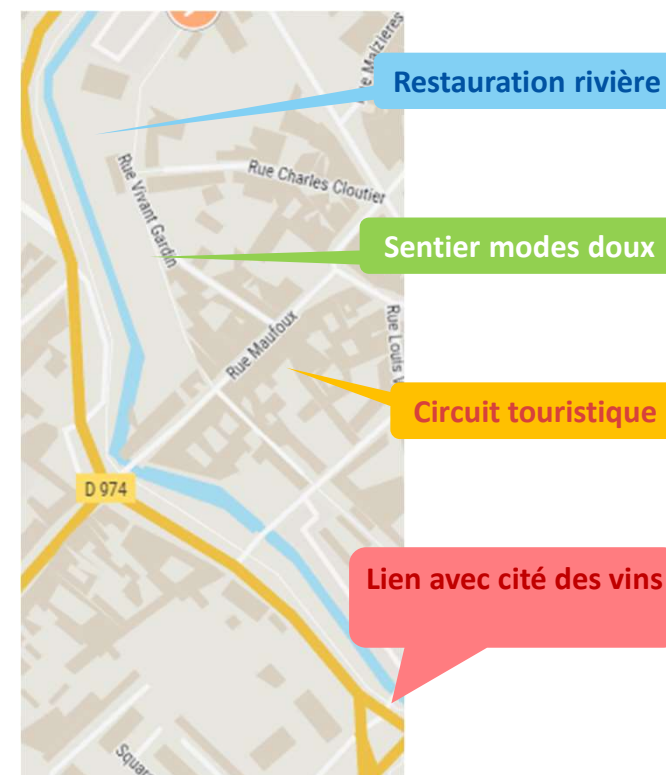
Projet de restauration de la Bouzaize à Beaune