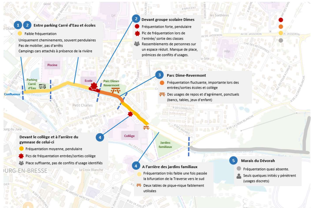
Usages et fréquentation au bord du Déborah à Bourg-en-Bresse