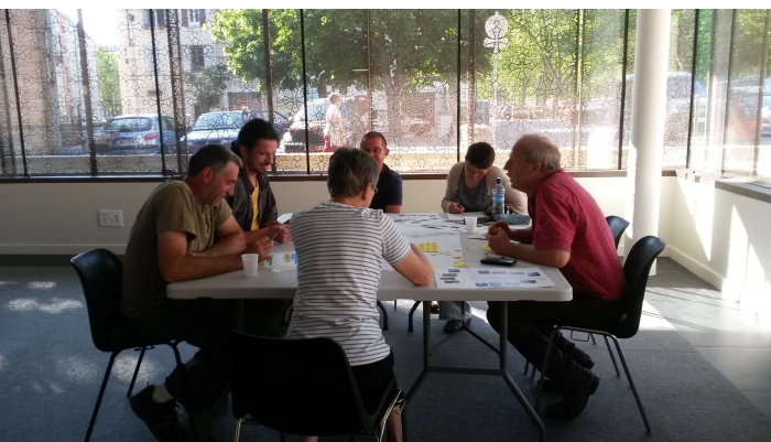
Atelier participatif sur la Lergue et la Soulondre à Lodève