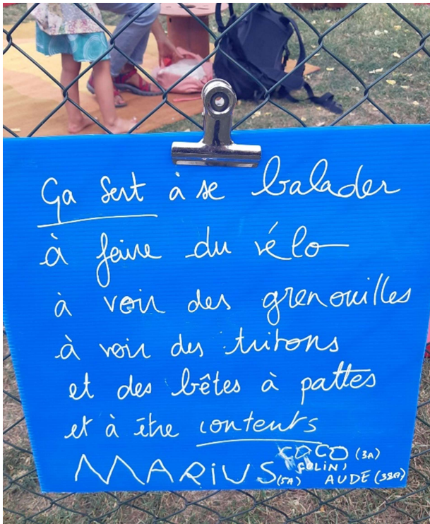
Dispositif « Porteurs de parole » sur le projet de restauration du Rhône pour le SMIRIL